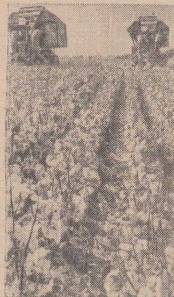
Туркменская ССР. Массовую уборку хлопка ведут механизаторы совхоза «Теджен» Марыйской области. Хлопководы решили завершить уборочную страду к 55-летию Великого Октября и дать стране 8200 тонн сырья.

Можно скормить, но еще ни в одном хозяйстве коровам столько соломы не дается. В колхозе «Россия» о запаривании соломы только разговоры идут, а в колхозе «Искра» у руководителей хозяйства и специалистов к запариванию соломы отношение явно отрицательное. Между тем только с 16 по 26 октября производство молока в колхозе «Россия» снизилось на 477 центнеров, в колхозе «Искра» — на 248. Удоя коров здесь продолжают сокращаться с каждым днем. Выход один — нужно преодолеть предвзятое отношение к соло-